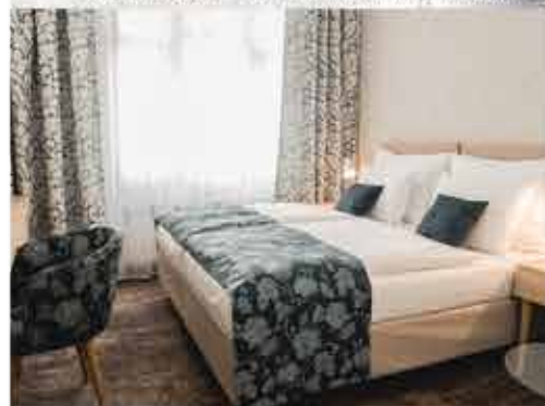
Zimmerbeispiel, 4+ ASTORIA Hotel & Medical Spa