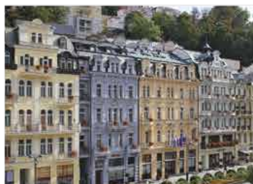
Außenansicht, 4+ ASTORIA Hotel & Medical Spa

Freizeit/Kur/Unterhaltung: Im neuen Wellnesszentrum des Hotels stehen Ihnen ein Schwimmbad (8 x 4 m, ca. 31°C) mit Gegenstromanlage und Massagedüsen, verschiedenen Saunen und Erlebnisduschen zur Verfügung. Hier erhalten Sie zudem die wohltuenden Anwendungen, für die das Hotel das natürliche Mineralwasser der Karlsbader Sprudelquelle nutzt.