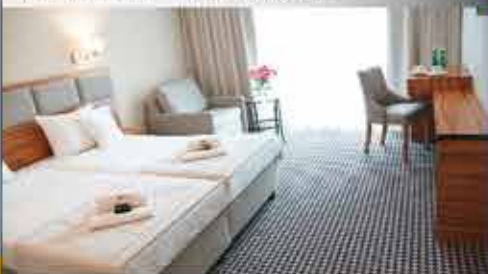
Zimmerbeispiel, 3++ Hotel Koral Live