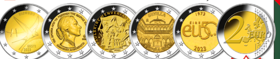
1.-5. 2-Euro Estland „Rauchschwalbe“ 2-Euro Griechenland „100. Geb. Maria Callas“ 2-Euro Deutschland „Paulskirchenverfassung“ 2-Euro Spanien „Altstadt von Sevilla“ 2-Euro Irland „50 Jahre EU-Beitritt“