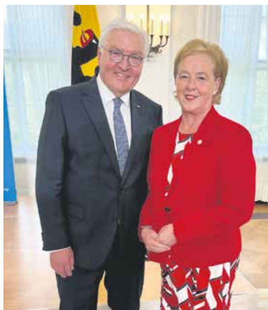
Staatspräsident Frank-Walter Steinmeier und die SoVD-Vorstandsvorsitzende Michaela Engelmeier.