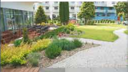
Hotelgarten, 3++ Hotel Koral Live